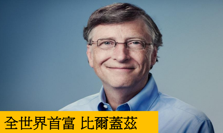
全世界首富 比爾蓋茲