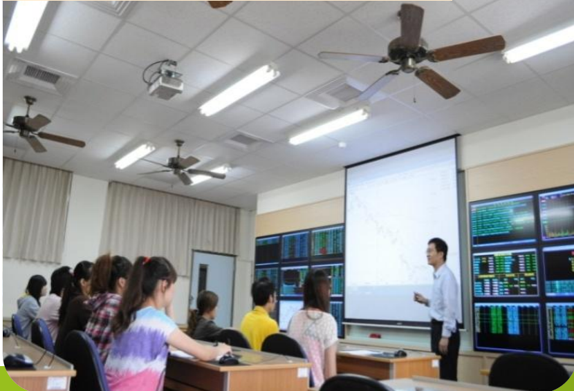
金融戰略交易實習室