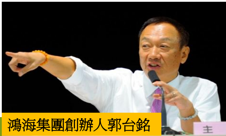
鴻海集團創辦人郭台銘