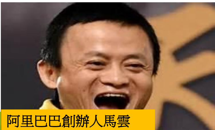
阿里巴巴創辦人馬雲