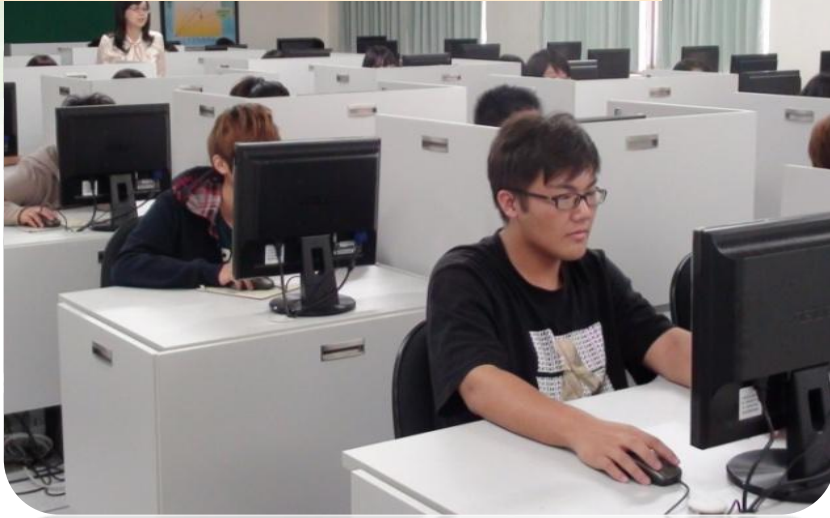
金融證照培訓實習室