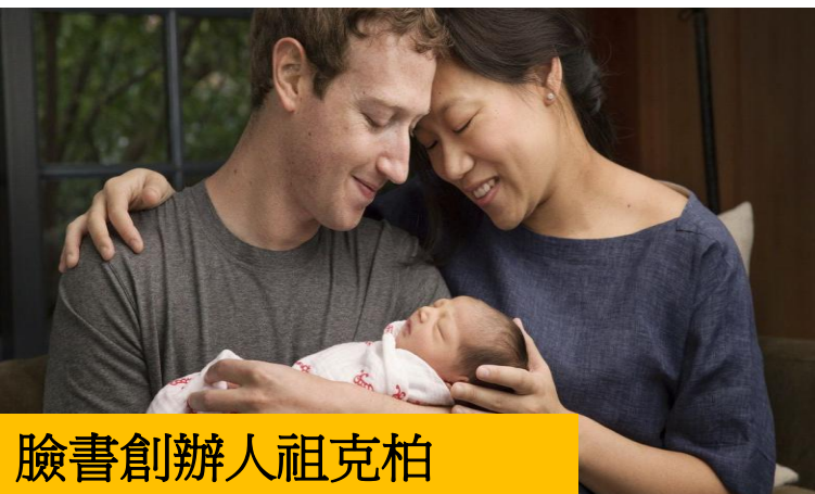
臉書創辦人祖克柏