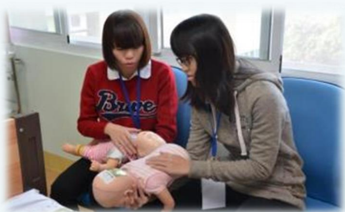
幼兒異物哽塞急救