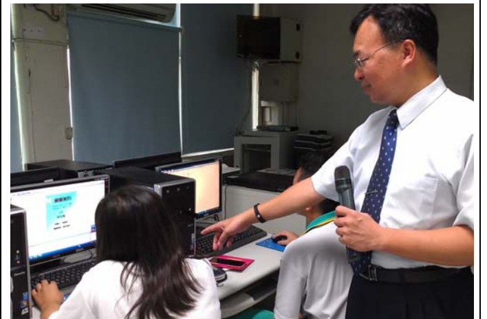
研習營活動授課情形-4