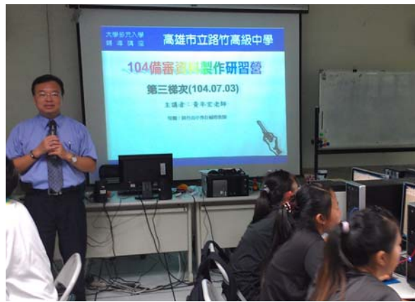
研習營活動授課情形-3