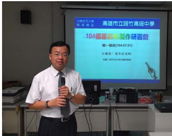
研習營活動授課情形-1