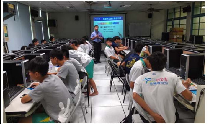
研習營活動授課情形-2