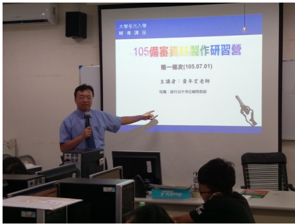
研習營活動授課情形-1