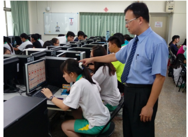
研習營活動授課情形-2