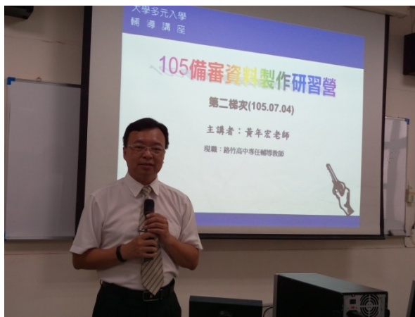
研習營活動授課情形-3