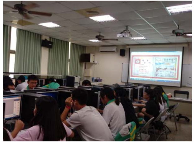
研習營活動授課情形-2