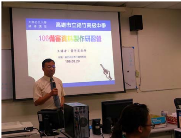
研習營活動授課情形-1