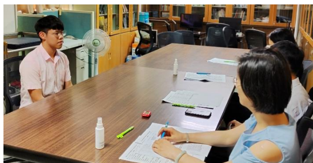
110年大學申請模擬面試