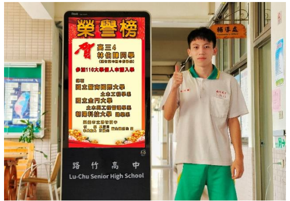
錄取大學榜單合照