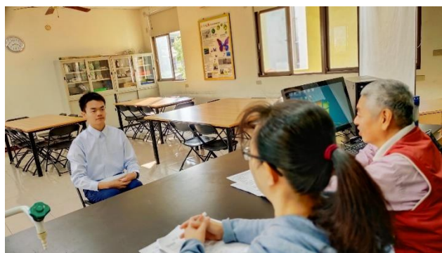
110年大學申請模擬面試