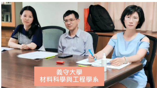
義守大學 材料科學與工程學系