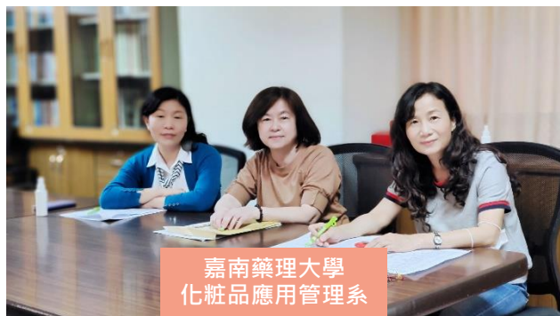
嘉南藥理大學 化粧品應用管理系