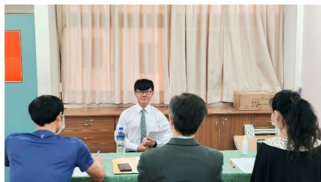
110年大學申請模擬面試