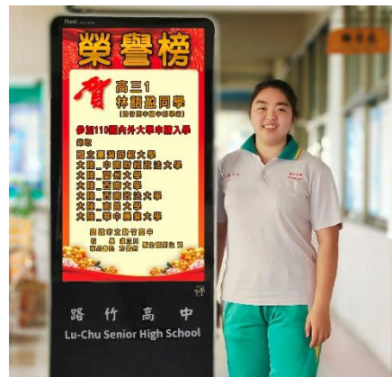
錄取國內外大學榜單合照