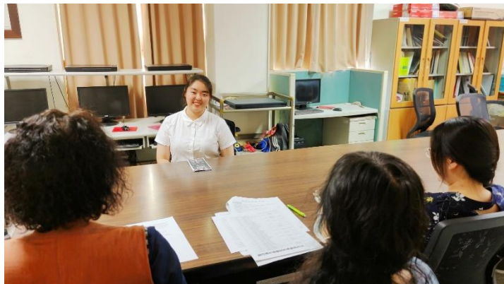
110年大學申請第一次模擬面試