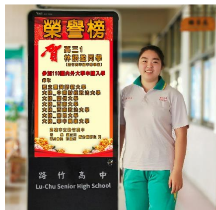
錄取國內外大學榜單合照