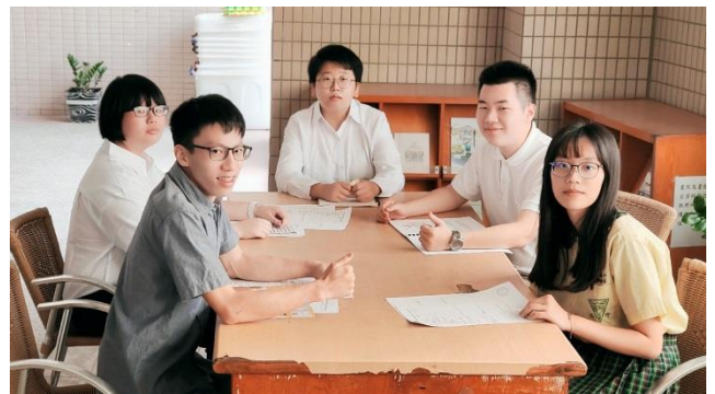
110年大學申請第一次模擬面試