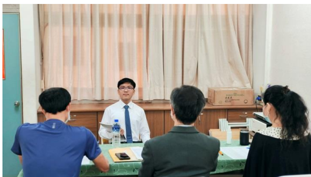
110年大學申請模擬面試