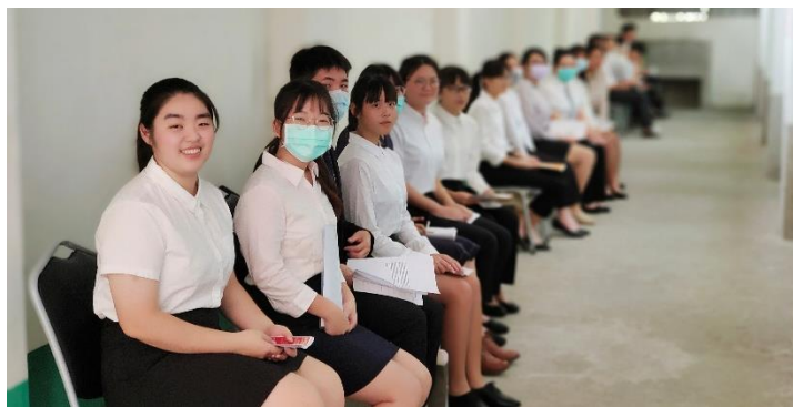
110年大學申請第二次模擬面試