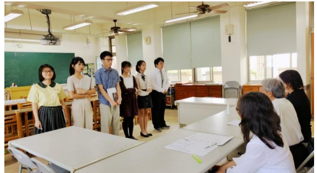
110年大學申請第二次模擬面試