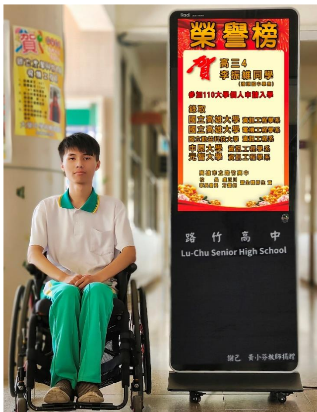
錄取大學榜單合照