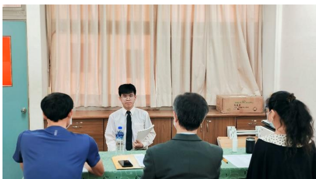
110年大學申請模擬面試