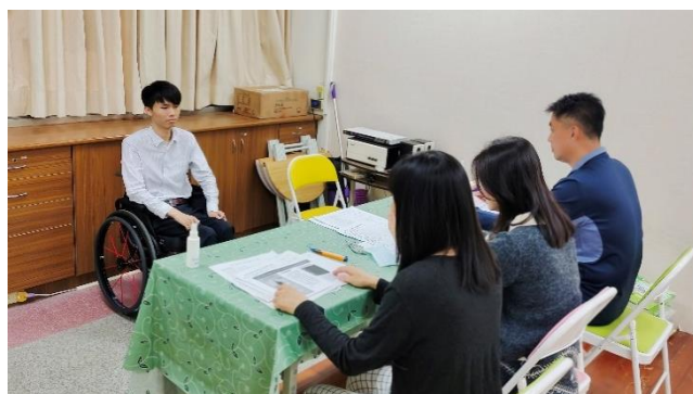
110年大學申請模擬面試